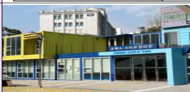
코맥스 스타트업 타운 (창업자 전용, 공용 공간)