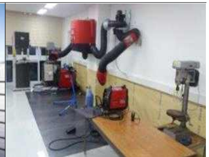
시제품 제작지원 공간(V-SPACE)