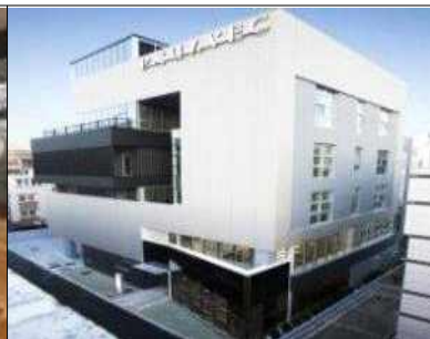
휴게실(효원산학협동관 2층 이노카페)