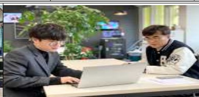
원스톱 창업멘토링 지원