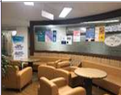
휴게실(효원산학협동관 2층 이노카페)