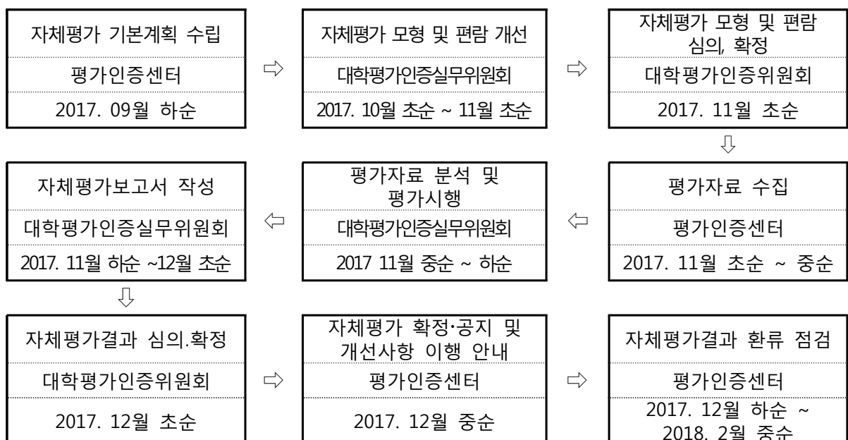
<자체평가 절차 및 일정>