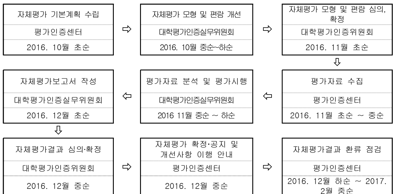
<자체평가 절차 및 일정>